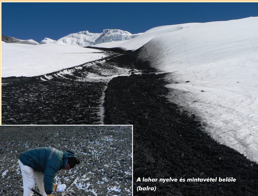
A lahar nyelve és mintavétel belőle (balra)

A 2007. szeptember 25-én érezhető kénes szag rögtön értelmet kapott, amikor nem sokkal 20.28 után a Ruapehu környékén a levegőben tartózkodó repülőgépek pilótái jelezték a légiforgalom irányításának: a vulkán felett majd 4 kilométer magas sötét füstfelhő látható az amúgy tiszta, holdvilágos éjszakában. Nem sokkal az értesítést követően a Geológiai és Atommagkutató Intézet (GNS) központjában észlelt szeizmikus adatokon is kiugrott egy kisebb, a Richter-skálán mért 2,8-erősségű földrengés jele. A két információ szinte egyidőben futott be a vulkáni aktivitást figyelő hálózatba, így az éppen ügyeletes vulkanológus azonnal akcióba lépett, s riasztotta a katasztrófaelhárítást, jelezvén, hogy a Ruapehu valószínűleg kitört. Az esti tíz órás hírekben már tényként szerepelt, hogy a váratlan, robbanásos kitörés lahart is indított, és az eseménynek sérültje is van. Egy hegymászóra szinte teljesen betemetve találtak rá, akinek a jéggel, hóval és vulkáni iszappal betemetett teste addigra már a kritikus 26 fokban hőmérsékletre hűlt le. A laharüledékből kiásva azonnal kórházba szállították, ahol szerencsére az éle-